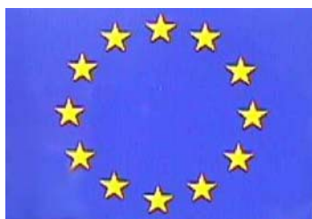
Europeiska unionen EU