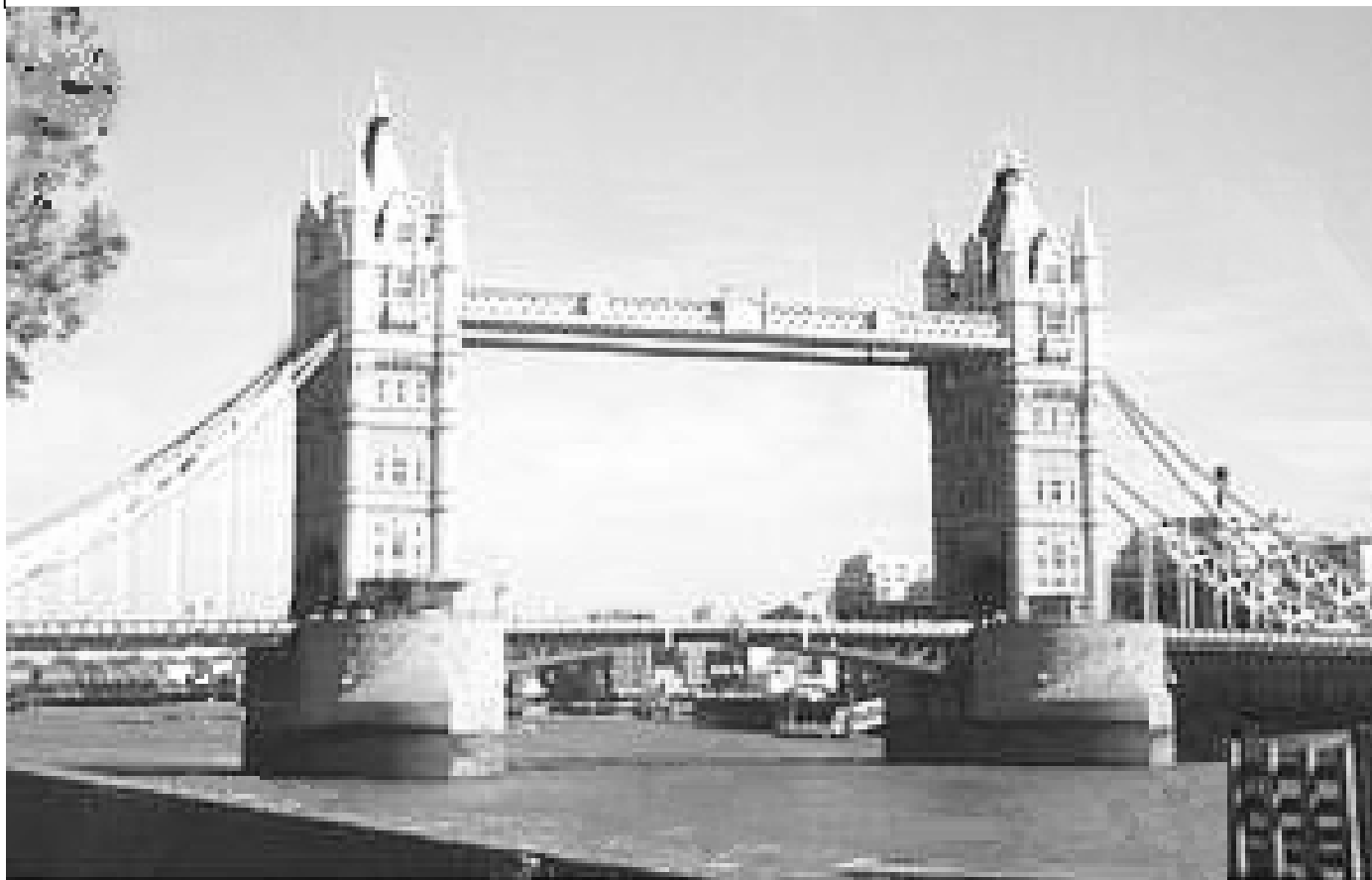
Tower Bridge i London, där WFM har kongress i juli.

Demokratipropositionen innehåller intressanta detaljer men få stora grepp, och försöken i Sverige med regionalt självstyre verkar nu tyvärr läggas ner.