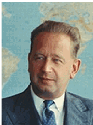
Dag Hammarskjöld, FN:s generalsekreterare 1953-1961

"... jag har ett ansvar gentemot alla de medlemsstater för vilka organisationen är av avgörande betydelse, ett ansvar som