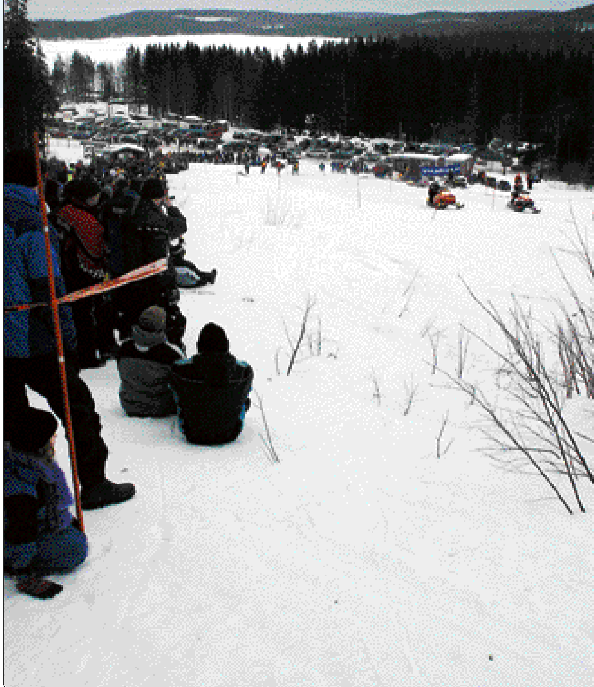
Gråkallt. Skoterfestivalen hölls i ett gråkallt och bistert väder. Här pågår dragracetävlingen.