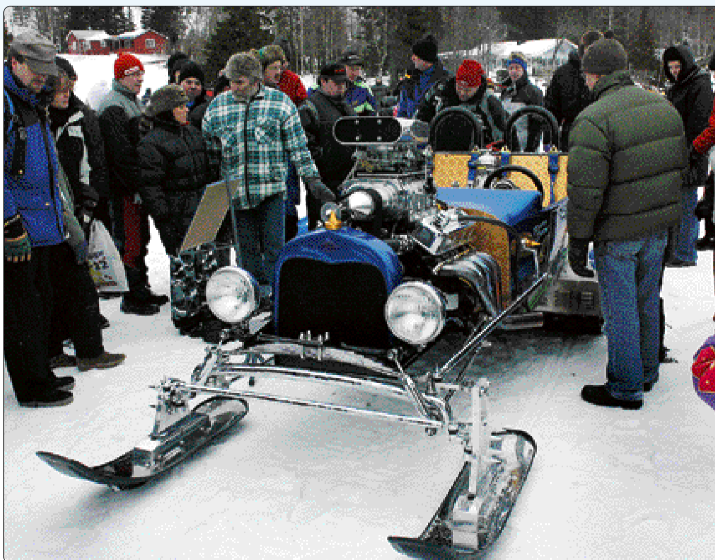
Många intresserade och förundrade blickar tilldrog sig snömonstret, hemmabygget som är en kombination mellan en gammal Ford, ett par snöskotrar och en Chevrolet.

Inte lika många skotrar som vanligt på Harsasjön. Men ett snömonster vars like ingen skadat.