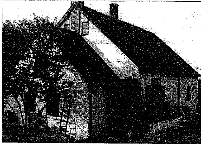
Herrgårdarnas Mejeri, Osbyholm vid Hörby i Skåne 1934.

så dålig att jag var tvungen att återvända till mejeriet efter knappt en mil. Detta var det enda nöje jag kostade på mig på hela året. Fritiden använde jag annars till att läsa en mejerikurs på Hermods Korrespondensinstitut. I avsaknad av någorlunda hyggliga gåbortskläder och även brist på vänner besökte jag inte någon nöjeställning. Den andre eleven hade sitt hem tio kilometer från mejeriet och kunde därför någon gång cykla hem.