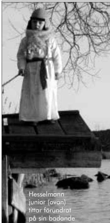
Hesselmann junior (ovan) tittar förundrat på sin badande far (nedan).