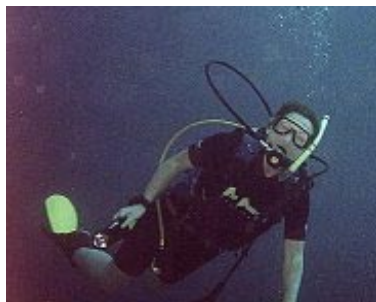
Artikelförfattaren under ett dyk på Maldiverna

Ingen som jag känner skulle nog vilja beskriva mig som en särskilt äventyrlig eller dumdristig person. Vissa tycker nog snarare att jag ibland är överdrivet petig och noga med att allt ska gå rätt till hela tiden, en riktig ”kontrollfreak”. En av de amerikanska besättningsmedlemmarna på dykbåten beskrev mig som en ”no-nonsense person”. Jag hade aldrig hört det uttrycket förut, men det stämmer nog ganska bra. Faktum är att överhuvud taget börja dyka var ett stort steg för mig, men nu tycker jag att det är jättekul. Jag tycker frihetskänslan och skönhetsupplevelsen är oslagbar, dock är jag inte mycket för extremdykning och att tänja på gränserna på olika sätt. Ingen skulle få ner mig i en isvak eller långt in i en trång grotta eller ner på hundra meters djup med konstiga gasblandningar... Jag är mycket nöjd med att simma runt på korallrev på 15–20 meters djup och beundra färgerna. Däremot är jag nog en ganska nyfiken person, hungrig på nya upplevelser, och jag har väldigt svårt att stå emot frestelser och vill gärna vara med när det händer något kul. (detta kommer att ha en viss betydelse i berättelsen). Jag har förutom på svenska västkusten varit och dykt i Röda Havet, på Maldiverna, på Malta (där jag tog mitt cert), i Australien, och nu sist i Truk i Mikronesien.