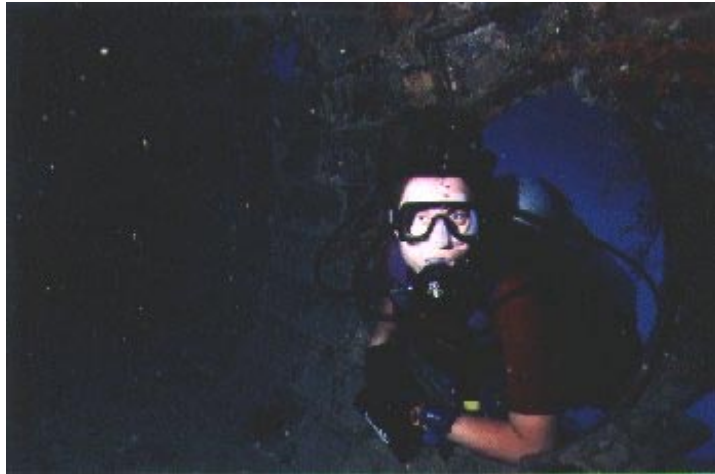
Artikelförfattaren halvvägs inne i "Betty Bomber"

En parentes: Vädret har varit fint hela dagen, det har varken varit vågor eller strömmar att tala om, och tack vare att vi är på en båt så behöver vi inte göra några ytsim direkt. Jag har inte varit speciellt stressad eller andfådd under något av dyken.